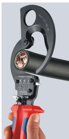
95 31 280: Увеличенный растров: максимальный Ø 52 мм/380 мм 2