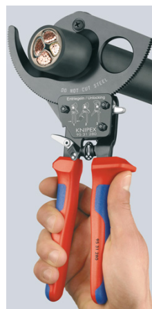
Принцип трещотки и двухходовой зубчатый привод для резания с меньшим усилием